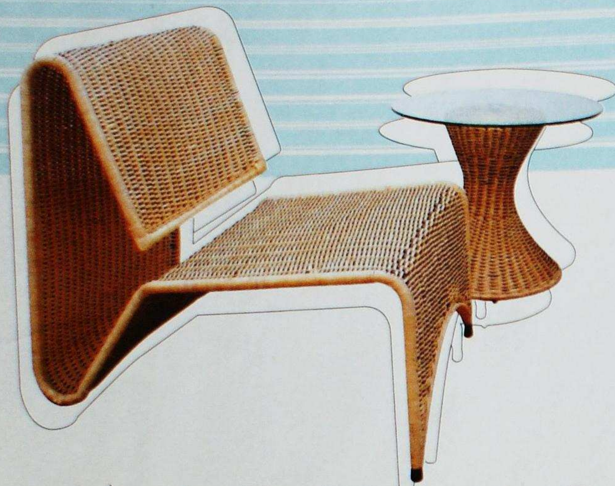
POLTRONA Se llama Togo, está realizada en tejido de mimbre, y es de la firma Kotta