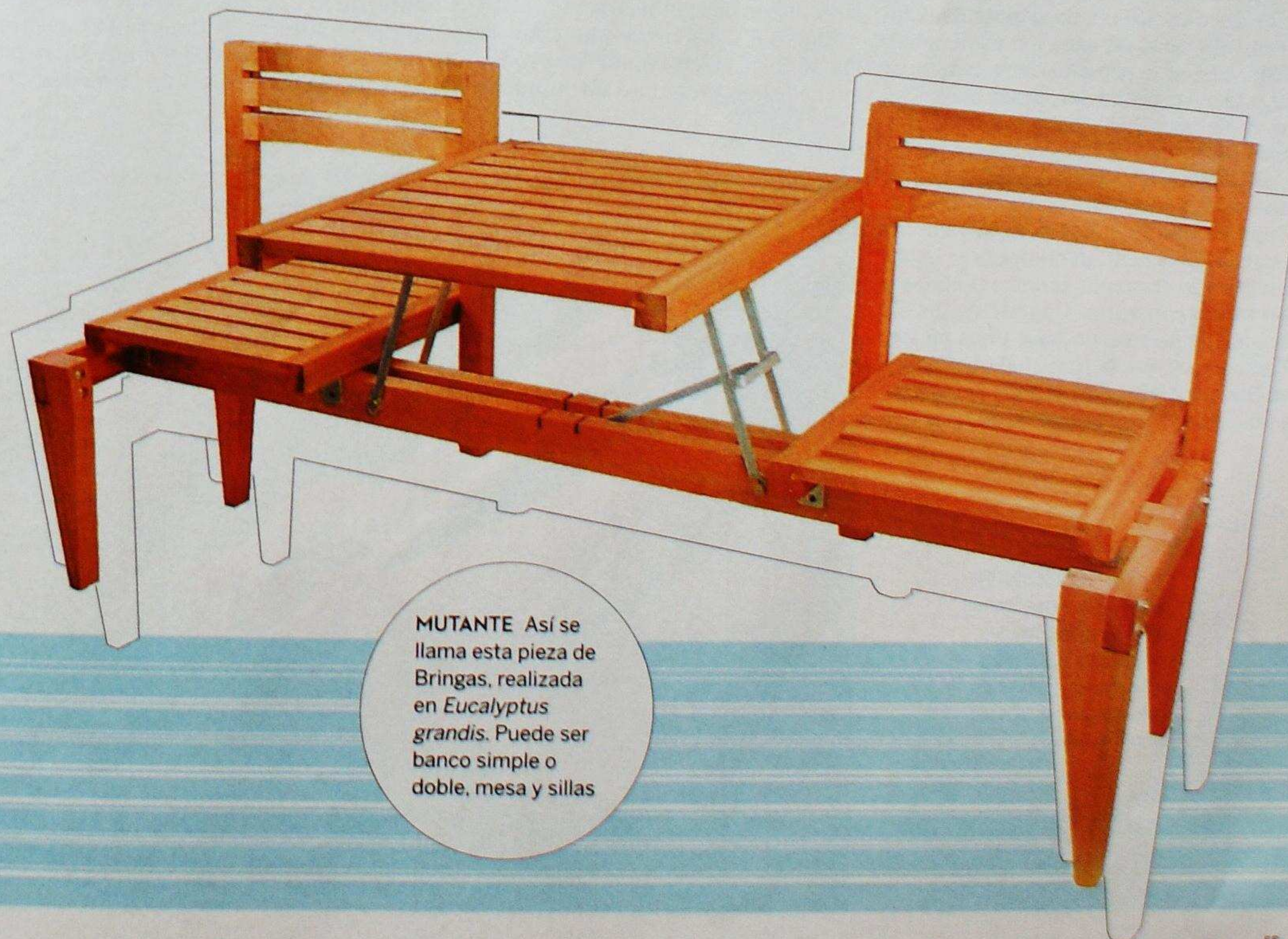
MUTANTE Así se llama esta pieza de Bringas, realizada en Eucalyptus grandis. Puede ser banco simple o doble, mesa y sillas