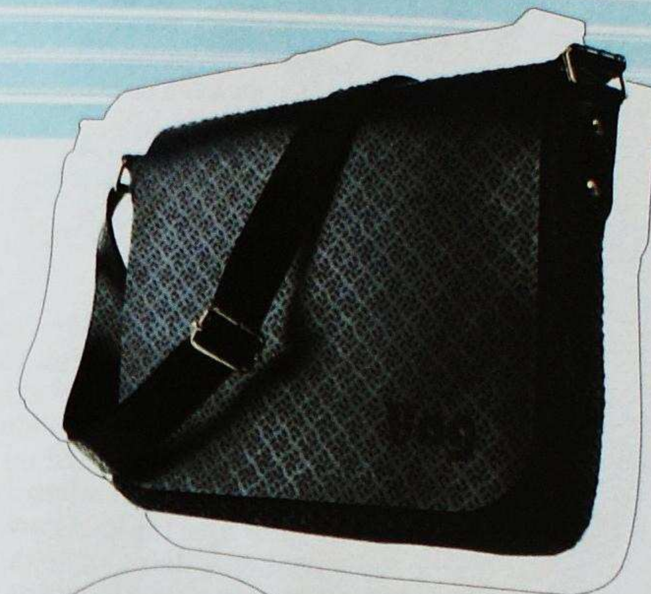
EN GOMA Bolsa Chicago, de tejido de lana al que le adosaron goma para pisos en correas y tapa (Vag)

A propósito del Bicentenario, el envío fue realizado de manera conjunta por la Cancillería y el Centro Metropolitano de